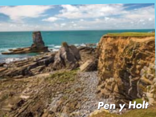
Pen y Holt

Dyma rai o'r uchafbwyntiau y mae cerddwyr wedi sôn wrthym amdanynt, mwynhewch wrth i chi ddod o hyd i'ch rhai chi eich hun a pheidiwch ag anghofio dweud wrthym amdanynt!