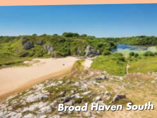
Broad Haven South

"Mae'r rhan orau o Broad Haven South i Skrinkle Haven, ond rhyw ddydd fe ddown yn ôl i edmygu'r cyfan unwaith eto."