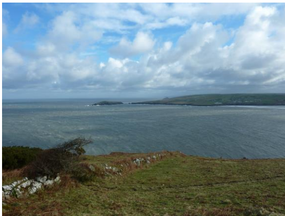
Edrych ar draws y bae tuag at Ynys Aberteifi d