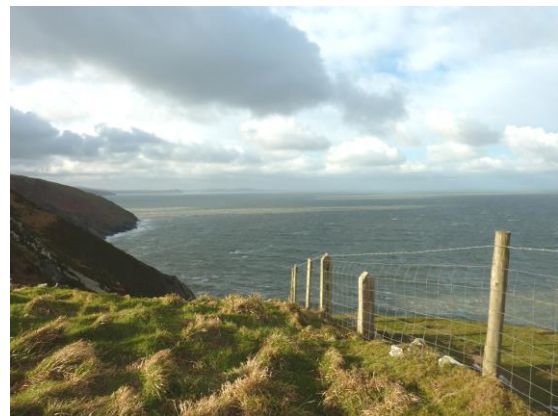
Edrych i'r gorllewin o Benrhyn Cemaes