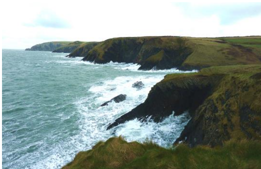
Edrych i'r gogledd ddwyrain o Gareg Wylan