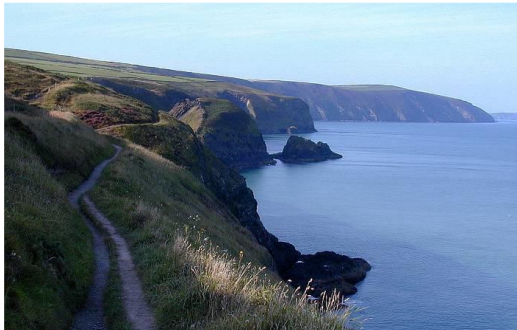
Edrych i gyfeiriad Bae Trefdraeth