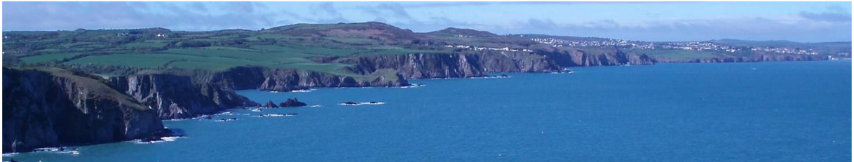
Edrych o Benrhyn Dinas de-orllewin i gyfeiriad Abergwaun