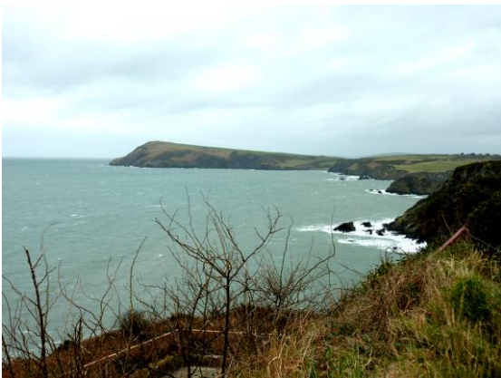
Edrych i'r dwyrain i Benrhyn Dinas o faes carafanau Penrhyn