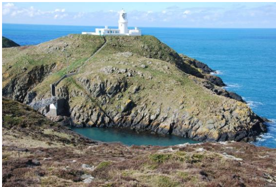
Y môr tu hwnt i oleudy Pen-caer [wedi ei gymryd o SCA 11]