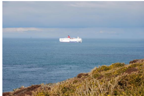
Y môr gyda'r cwch fferi'n gadael yr ardal am ddyfroedd sy'n agosach at Abergwaun