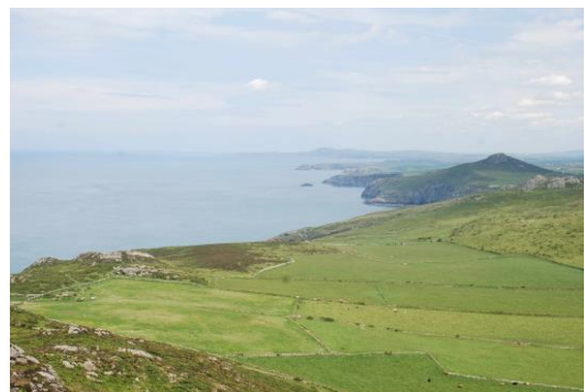
Carn Penberry o Garn Llidi yn edrych tua'r gogledd ddwyrain