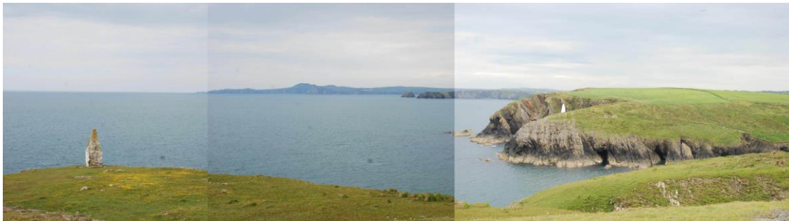
Marcwyr porthladd Porthgain yn edrych tua'r gogledd ddwyrain tuag at Ben-caer