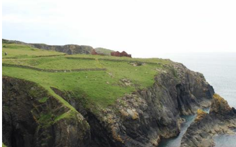
Porth Ffynnon - i'r gorllewin o Borthgain - gydag adeilad y chwarel