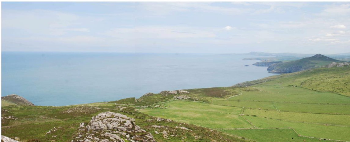
Golygfa o gydran ogleddol ardal Carn Llidi yn SCA14 gyda SCA13 a SCA28 yn y canol