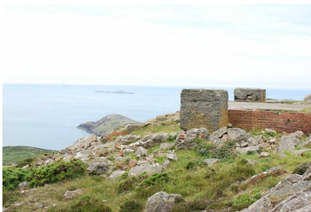
Yr olygfa tua'r gorllewin o Garn Llidi yn dangos adfeilion o'r Ail Rhyfel Byd