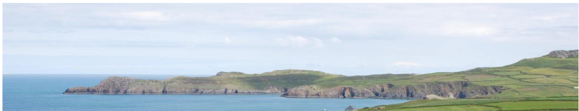
Pentir Tyddewi yn edrych ar draws Traeth Mawr o Garn Rhosson