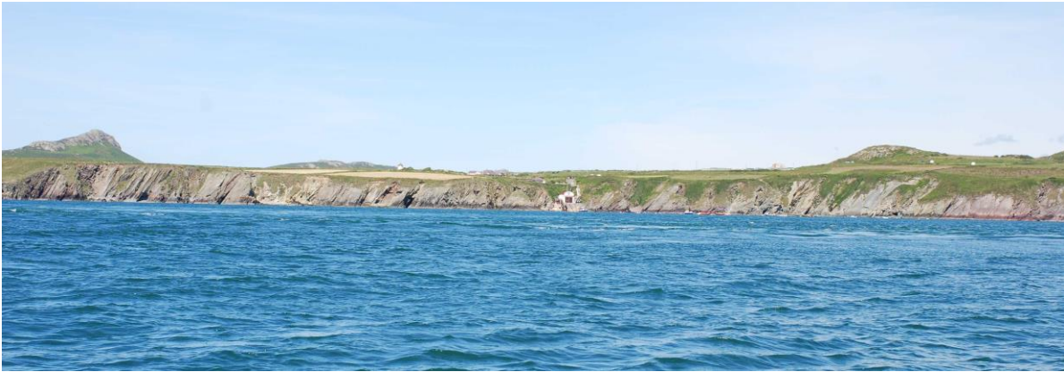
Arfordir y prif dir o Swnt Dewi - mae gorsaf y bad achub mewn lleoliad canolog gyda Charn Llidi i'r chwith a Charn Rhosson i'r dde