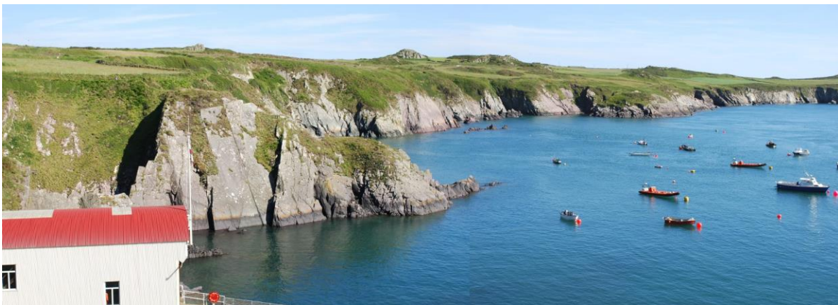
Porthstinian gyda gorsaf y bad achub a'r angorfeydd