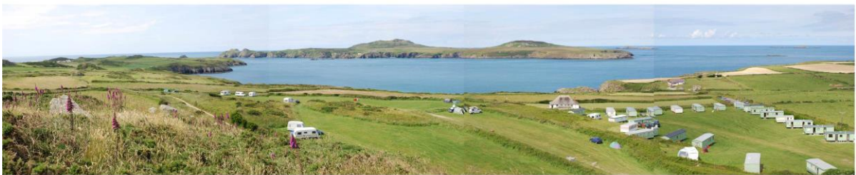
Swnt Dewi o Garn Rhosson