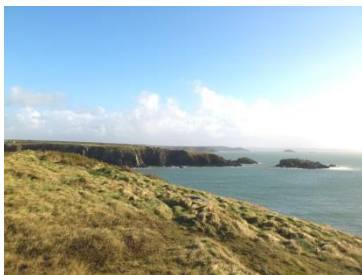
I'r dwyrain o Gaerfai