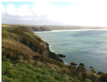
I'r dwyrain o gerllaw i Dinas Fach