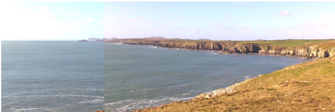
Edrych i'r gorllewin o gerllaw Caerfai i Ynys Dewi yn y pellter