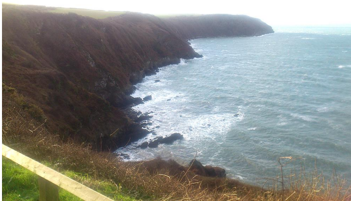
Edrych tua'r gorllewin tuag at Borough Head