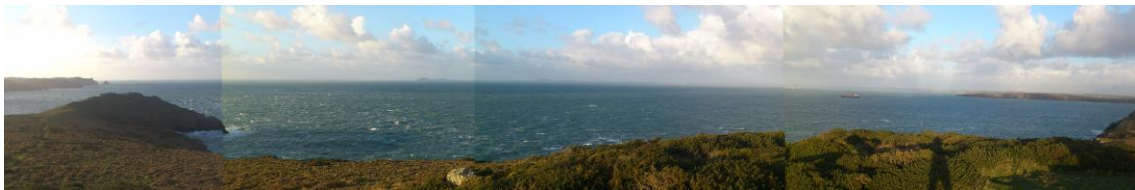
Bae Sain Ffraid o Nab Head gyda Sgomer i'r chwith