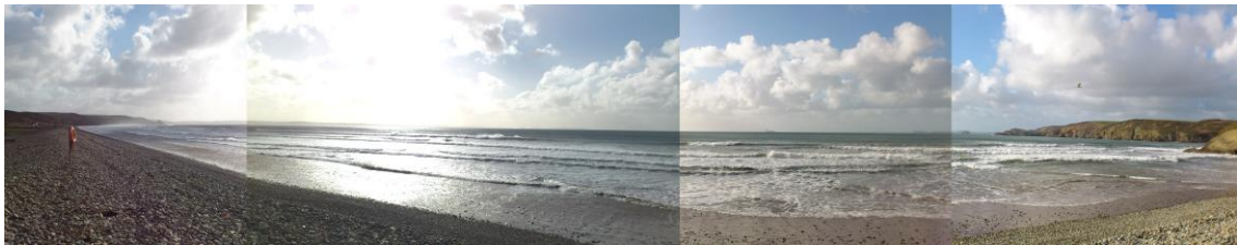
Bae Sain Ffraid o Niwawl