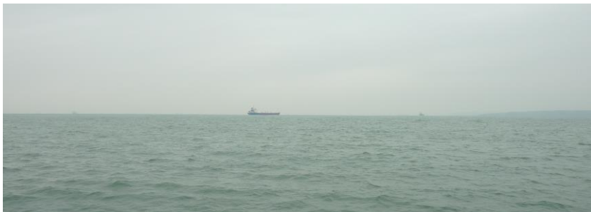
— Yr olygfa o'r môr i'r gogledd o Sgomer