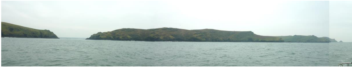
Edrych at Sgomer o'r môr, tua 500m i'r gogledd