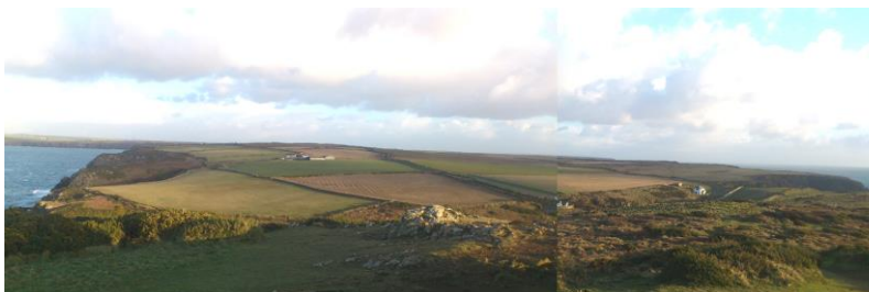
Penrhyn Marloes yn edrych tua'r dwyrain