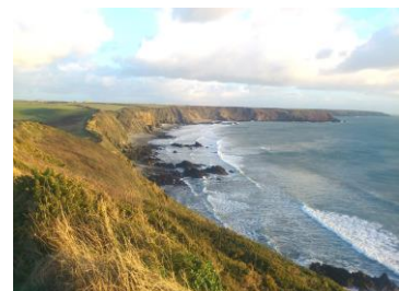
Traeth Marloes yn edrych tua'r de-ddwyrain