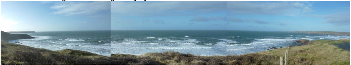
Ardal allan i'r môr o Freshwater West (yn SCA34)