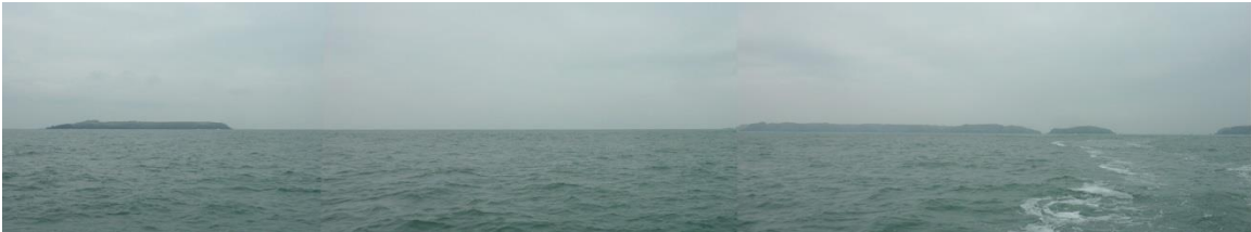
Ardal a welir rhwng Skokholm a Sgomer yn y môr