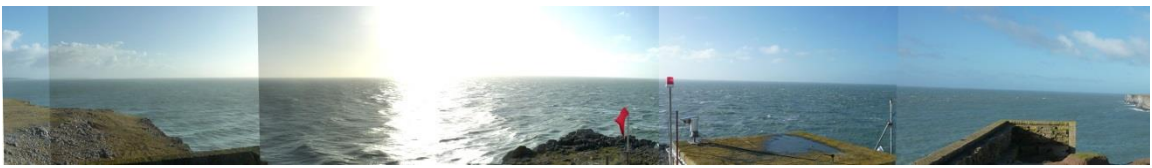
Ardal allan i'r môr o Benrhyn Sant Gofan (yn SCA35)