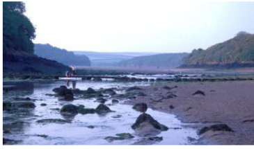
Sandyhaven Pill