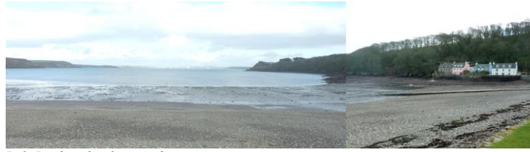
Dale Roads with refinery in distance