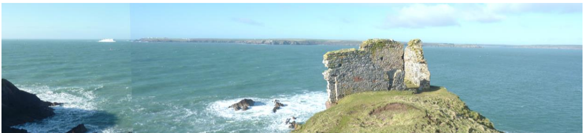
Mouth of Milford Sound from near Rat Island, with ferry off St Ann's Head