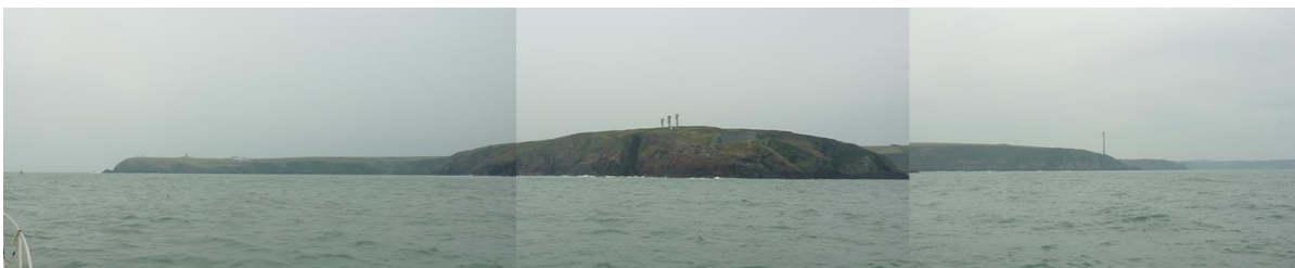
In the mouth of the Sound approx 500m from shore