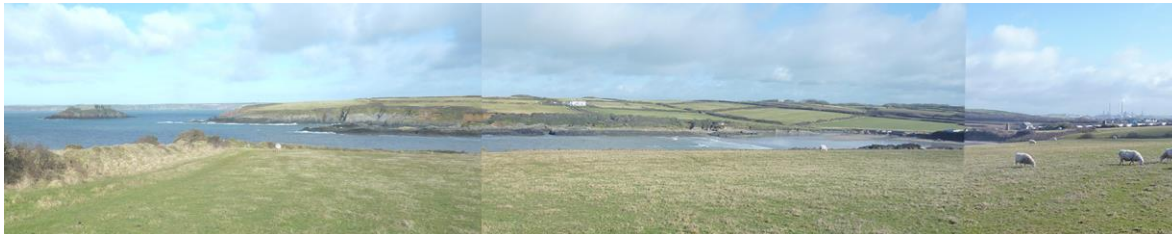
Panorama yn edrych tua'r gogledd dros Fae Angle, gyda'r burfa olew yn y golwg ar y dde