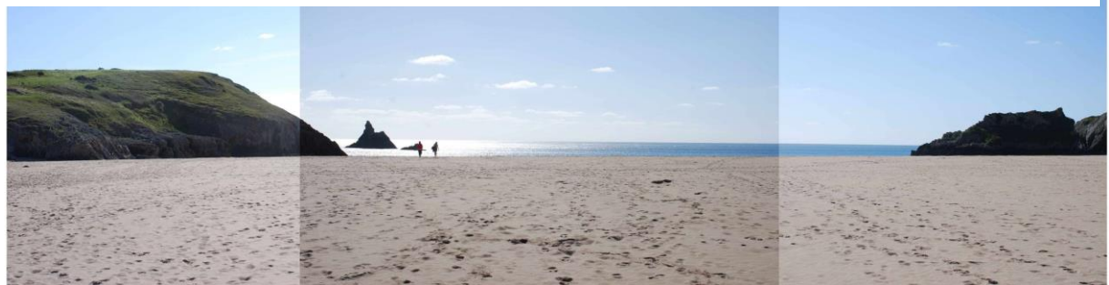
Traeth Aber Llydan yn edrych tuag at Graig yr Eglwys