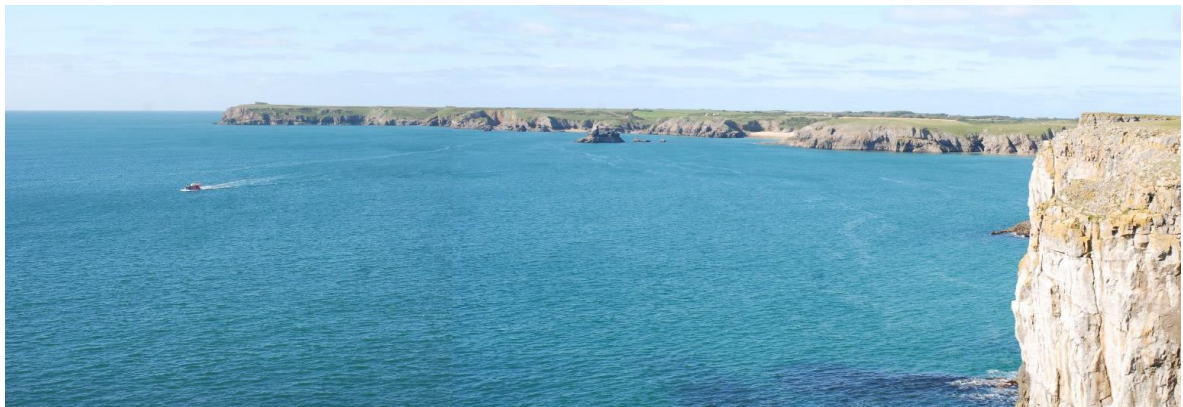
Yr olygfa at Ben Gofan o Benrhyn Ystagbwll