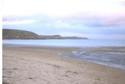
Freshwater East yn edrych tua'r dwyrain