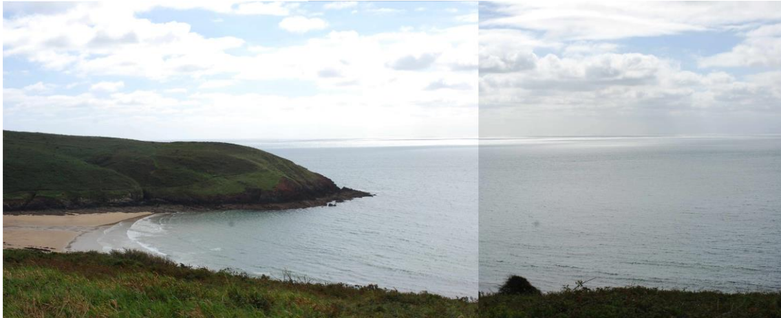
Traeth Maenorbŷr a Thrwyn yr Offeiriad