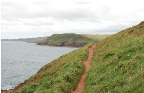
Llwybr v cloewni ar Drwyn yr Offeiriad yn edruch tua'r gorllewin