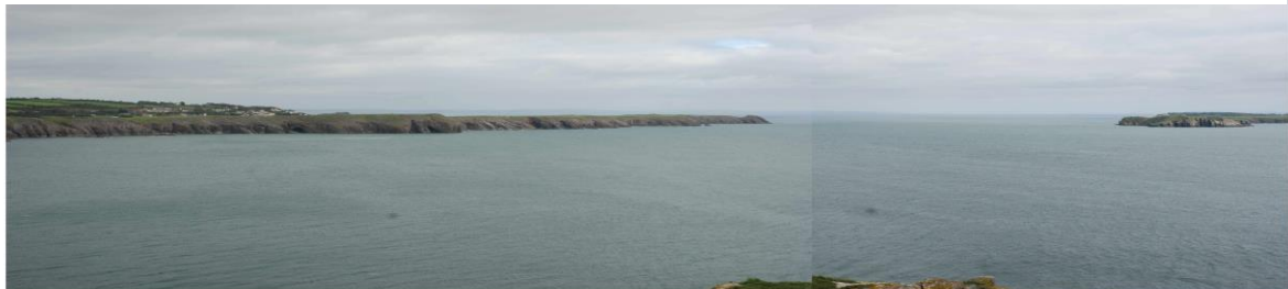
Edrych tua'r dwyrain o Drwyn Lydstep i Swnt Pŷr