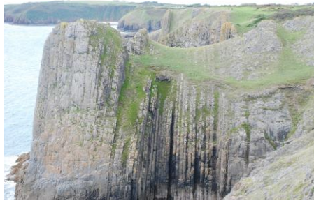
Craig Whitesheet o Drwyn Lydstep yn edrych tua'r gorllewin