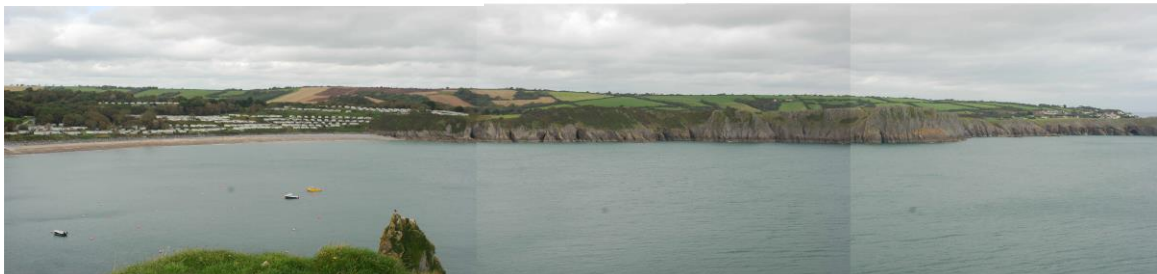
Bae Lydstep o Drwyn Lydstep