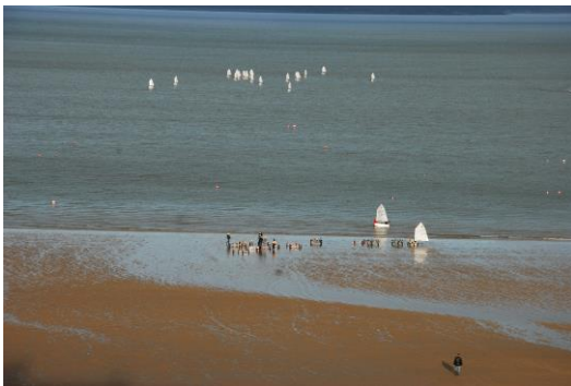
Dinbych y Pysgod- sailing dinghy activity off North Beach