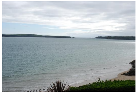
Golwg o Ynys Byr o draeth y De