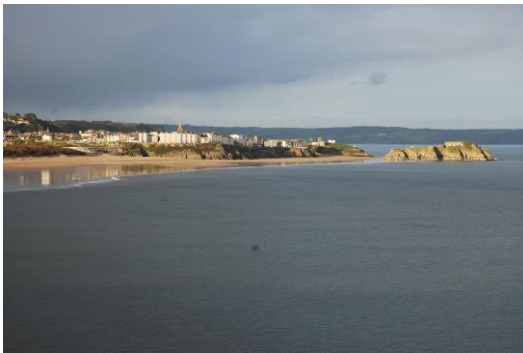
Dinbych y Pysgod a'r meindur a'r de