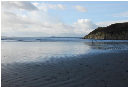
Yr olygfa tua'r gorllewin