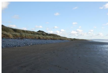
Yr olygfa tua'r dwyrain ar hyd Traeth Pen-bre