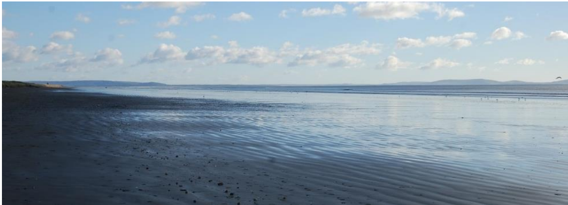
Yr olygfa tua'r de-ddwyrain ar draws Bae Caerfyrddin tuag at Gŵyr